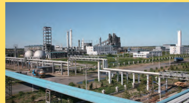
梅花グループの通遼工場