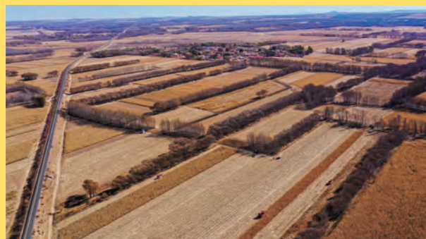
通遼工場周辺に広がるとうもろこし畑

無尽蔵とも思われる内モンゴルの大平原に広がる 果てしないとうもろこし畑の真ん中に梅花工場は立地しています。 日本国特許で認められたイノベティブな新製法で 完全一貫で生産され、絶対的な安定供給力と コストの最小化を実現 しました。 中国から世界に現在年間 3万トン 規模を販売しており、 BCP対応 にもお役立ていただけます。